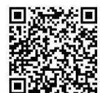
QR CODE แผนที่โรงแรม