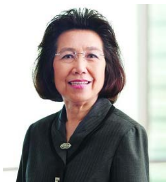
การอบรมหลักสูตรกรรมการและผู้บริหาร